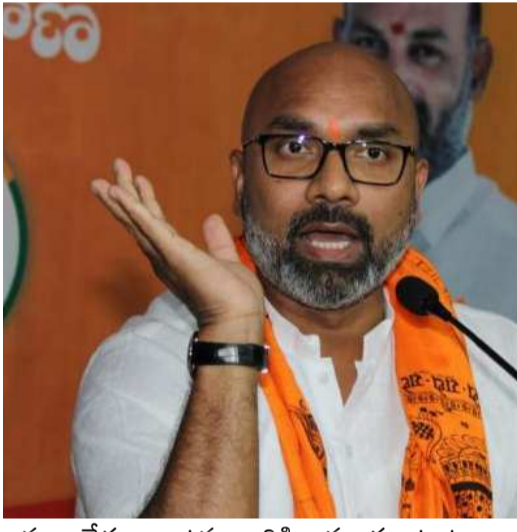
ముఖ్యనేతలుగా ఉన్న వారికి అవకాశం ఉంటుందా? అన్నది తెలాల్సి ఉంది. ఇటీవల రాష్ట్రంలో జరిగిన ఎమ్మెల్యే ఎన్నికల్లో రెండు స్థానాలను భాజపా కైవసం చేసుకోవడం ఆ పార్టీ శ్రేణుల్లో జోష్ పెంచింది.