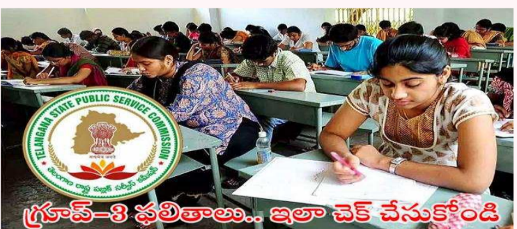
గ్రూప్-3 ఫలితాలు.. ఇలా చెక్ చేసుకోండి

హైదరాబాద్, మార్చి 14: గ్రూప్-3 జనరల్ ర్యాంకింగ్ లిస్టును (జీఆర్ఎల్) టీజీపీఎస్సీ శుక్రవారం విడుదల చేసింది. 2.5లక్షలకు పైగా అభ్యర్థుల ర్యాంకులను ప్రకటించింది. జీఆర్ఎల్తోపాటు గ్రూప్-3 పైల్డ్ కీ, మాస్టర్ ప్రశ్నపత్రాన్ని సైతం కమిషన్ వెబ్సైట్లో పొందుపరిచింది. 1,388 పోస్టుల భర్తీకి నవంబర్ 17, 18న టీజీపీఎస్సీ రాత పరీక్ష నిర్వహించింది. 5,36,400 మంది అభ్యర్థులు దరఖాస్తులు సమర్పించగా, 2,67,921 మంది పరీక్షకు హాజరయ్యారు. టాప్-10 ర్యాంకుల్లో 9 ర్యాంకులు పురుషులే సొంతం చేసుకున్నారు. కేవలం 8వ ర్యాంకు మాత్రమే మహిళా అభ్యర్థి కైవసం చేసుకోవడం గమనార్హం. సర్టిఫికేట్ వెరిఫికేషన్ కు ఎంపికైన వారి వివరాలను వెబ్సైట్లో పొందుపరుస్తామని, వ్యక్తిగతంగా సమాచారమిస్తామని టీజీపీఎస్సీ తెలిపింది. సాంకేతిక సమస్యలంటే 040-23542185, 23542187 నంబర్లు, helpdesk@tspsc.gov.in. ఈ-మెయిల్ ను సంప్రదించాలని సూచించింది.